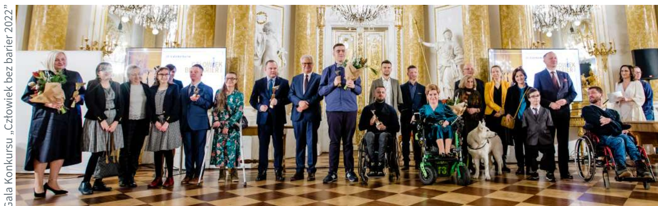
Gala Konkursu „Człowiek bez barier 2022”